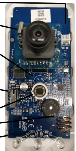
FIG. 2: Scheda Sensore WIRCAM